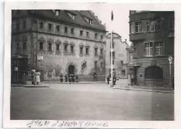
1907. R. H. Young's Office