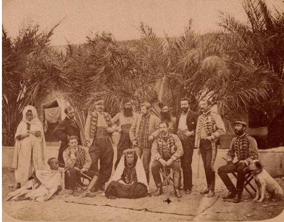
Les mêmes officiers entourés d'indigènes de la tribu des Ouled naïls